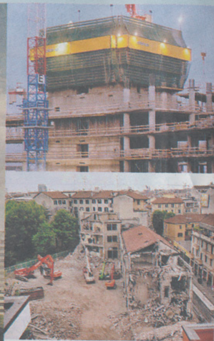
SKYLINE A sinistra la presentazione dei tre grattacieli dell'area CityLife. In alto due cantieri aperti nel capoluogo lombardo. Con l'Expo 2015 è esplosa la corsa al cemento, in ballo un giro di affari miliardario e un aumento demografico di 700 mila abitanti

Luigi Zunino, esposto con le banche, soprattutto Intesa-San Paolo, per 2 miliardi.